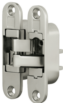
DOBRADIÇA INVISÍVEL 3D INVISIBLE HINGE