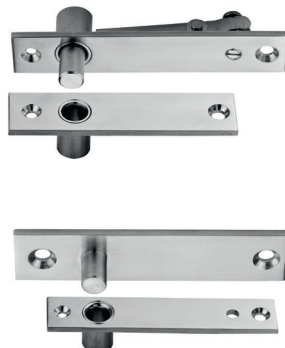
DOBRADIÇA PIVOTANTE PIVOT HINGE